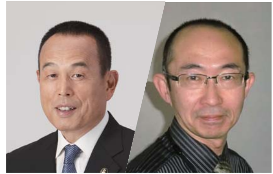
加山俊夫 （相模原市長）

地域の魅力を高めるヒント ～シティプロモーションの最新事情～ 東海大学文学部広報メディア学科 河井孝仁 教授