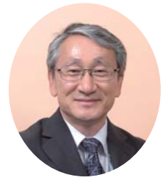
川口淳一郎氏 （JAXA 教授）

「市民を本気にさせないシティプロモーションに価値はない」と言われているように、地域の人たちの“わが街”に対する想い＝シビックプライドこそが、地域の活性化につながります。幾多の困難を乗り越え帰還を果たし、震災後の日本に勇気とプライドを与えてくれた小惑星探査機「はやぶさ」のプロジェクトマネージャー川口淳一郎教授をゲストに迎え、市民や職員が一体となったシビックプライドを通したまちづくりを考えます。