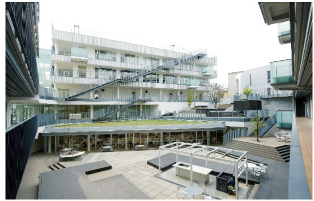
中野キャンパス 2号館前