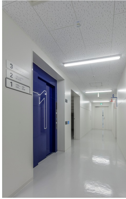
エレベーター付近