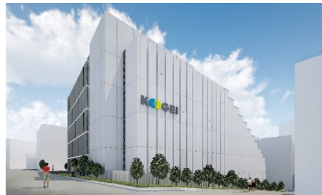
中野キャンパス 6号館(完成予想図)