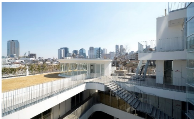
中野キャンパス 3号館